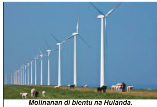
Molinanan di bientu na Hulanda.